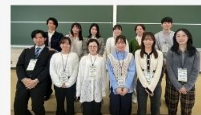
昨年登壇いただいた先輩たち

【保護者向けあり！】 今までのチャレンジやこれまでの講座を踏まえて大学1年生全体を振り返り、就活・進路選択につなげます。インターネットで就活情報を調べても秋田県からの就活や秋田大学に特化した情報はなかなか見つかりません。 秋田大に特化した具体的な就活事情 をお伝えします。 エントリーシート の記入の練習も行いますので、アルバイトやインターン、就活に役立てられるお土産になります。